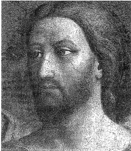
Het gelaat van Christus , fragment van 'Il Tributo', Masaccio, Brancacci-kapel, Florence

Wij kunnen ons nu alleen nog deze ene vraag stellen: Hoe kan het dat deze hypothese zich voor hen niet al eerder had aangediend? Het ontstaan van deze hypothese is een gave, zij is genade.